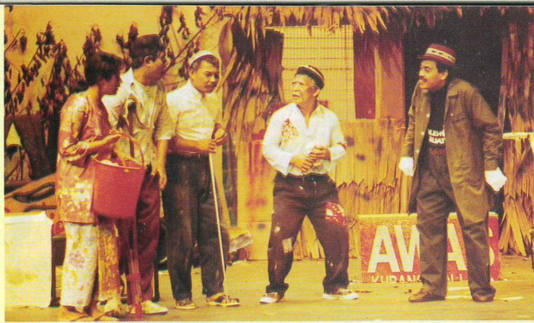
NAIB JUARA: Kumpulan Astaka Sari, Pulau Pinang dengan persembahan drama - 'MAYAT'