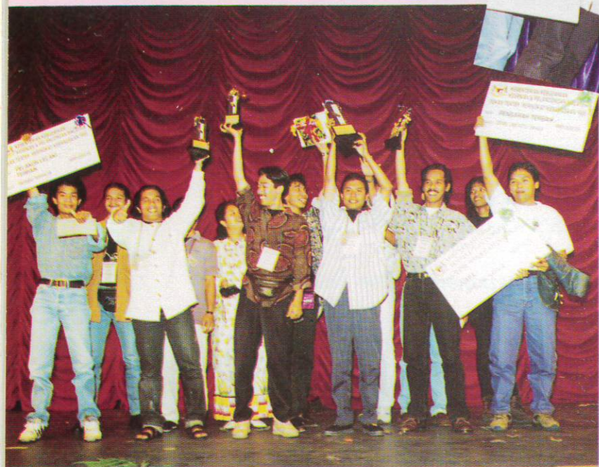
JUARA: Kelompok Sanggar Teater Terengganu dengan dramanya 'MAYAT'