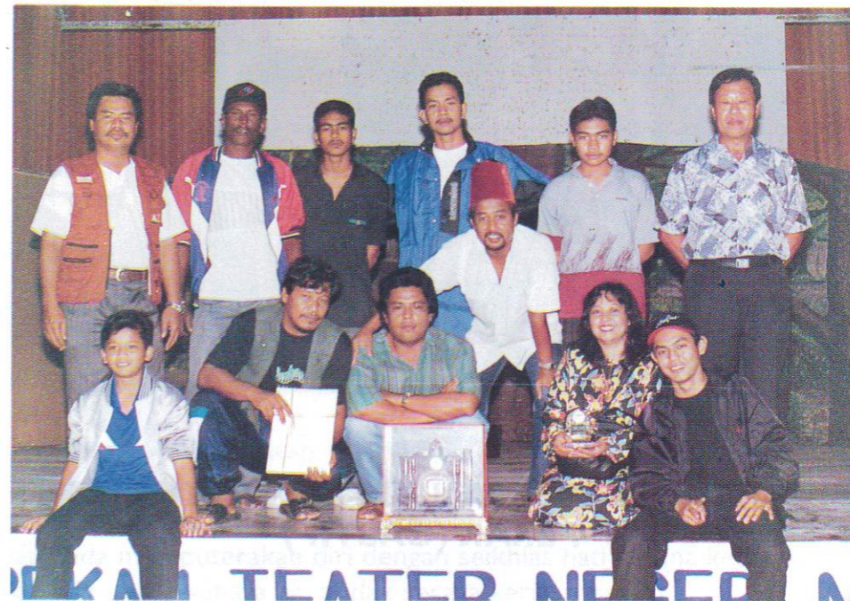
KUMPULAN ARTIS TEATER AMATUR (KATA) MELAKA

KATA ditubuhkan pada tahun 80an tetapi telah bergiat aktif menyertai Pekan Teater negeri pada tahun 1993.