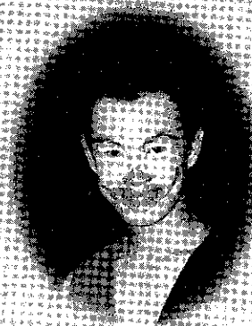
Snout Jezzriq Eddie Kismilardy