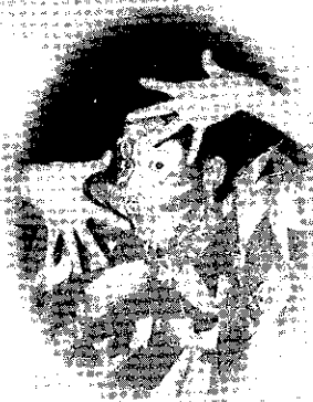
Duck Shahrul Mizad Asaari