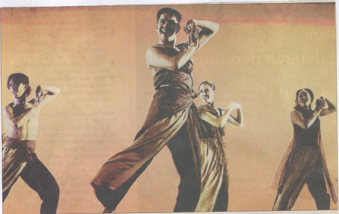
SALAH satu gerak tari dalam drama tari kontemporari Awas!