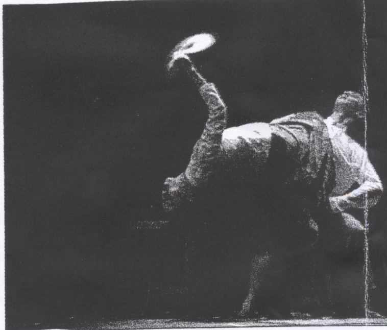
DUA peserta menunjukkan kehebatan mereka.